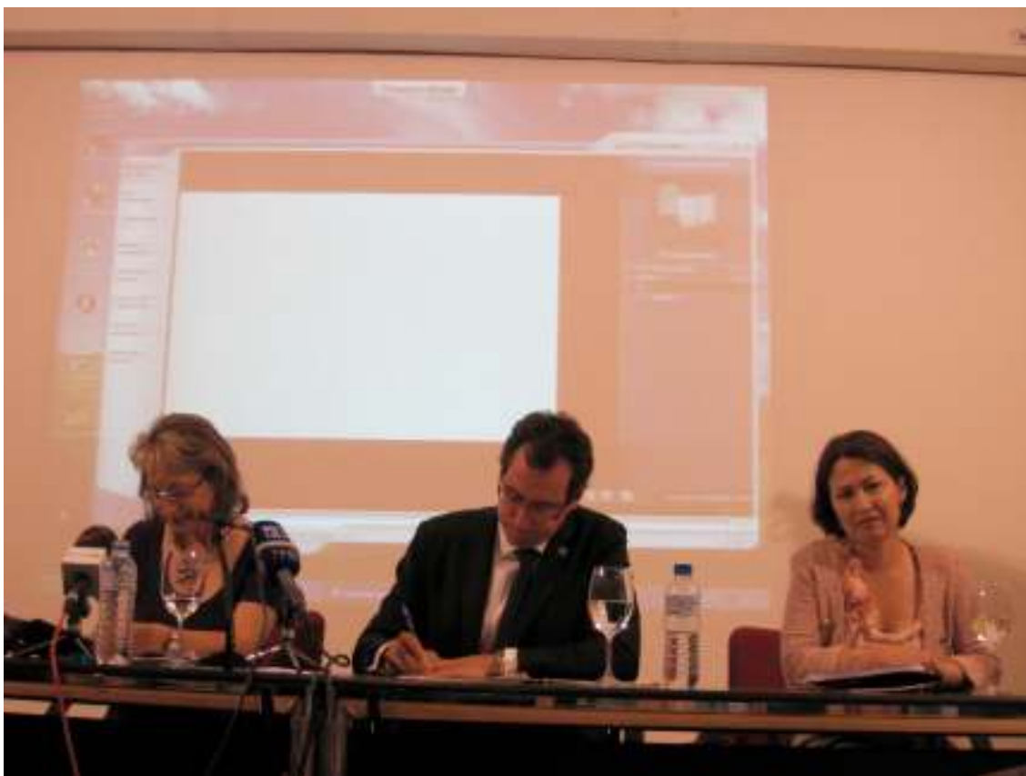
ACTO DE INAUGURACIÓN