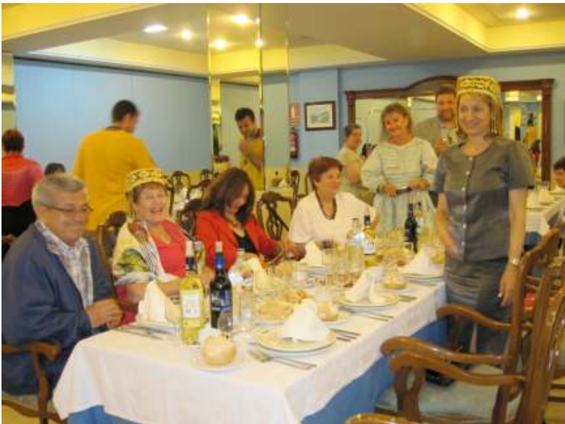
CENA DE CLAUSURA