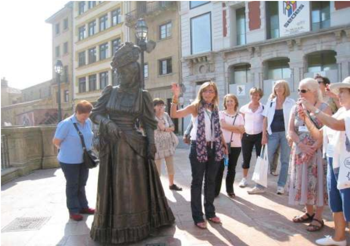
EXCURSIÓN: EN OVIEDO, ANTE LA REGENTA