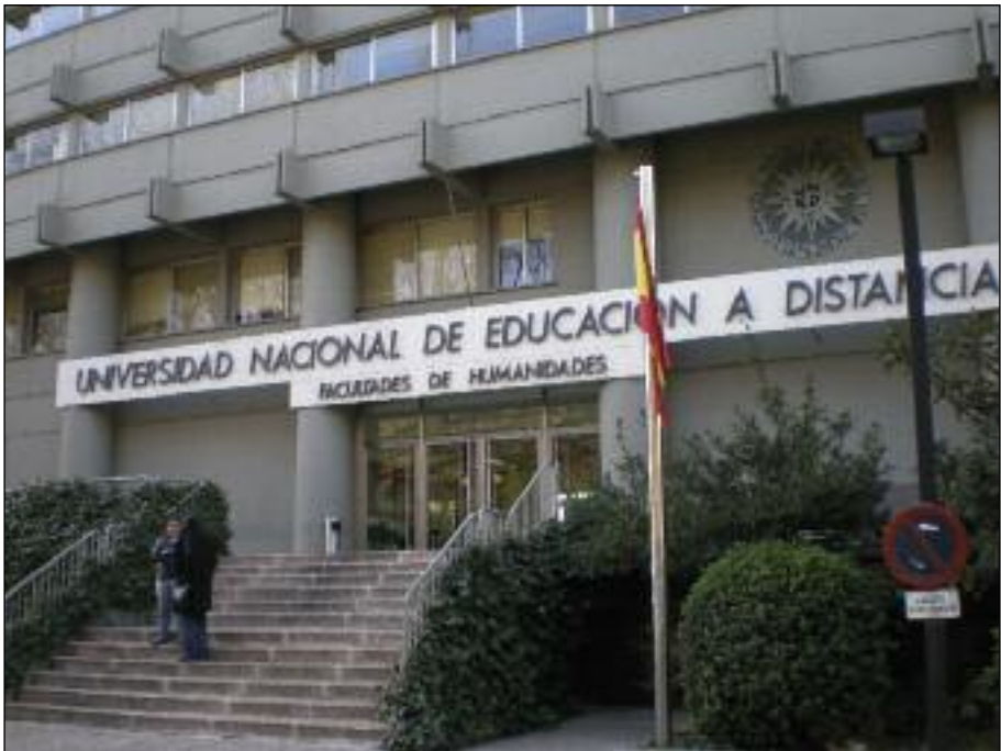
Edificio de Humanidades, UNED, Campus Senda del Rey

XLIII CONGRESO INTERNACIONAL DE LA AEPE Universidad Nacional de Educación a Distancia (UNED) Inauguración Instituto Cervantes, 28 de julio de 2008 Madrid, 27 de julio al 1 de agosto, 2008