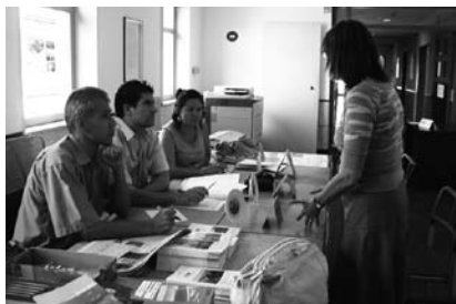
Nuestros becarios se encargan de la matrícula.