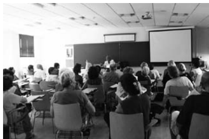
Sesión de trabajo.