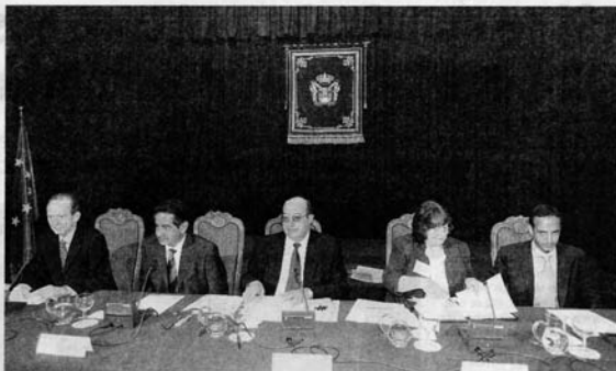
Comité de honor de la inauguración del Congreso Internacional de la AEPE.