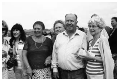
En San Vicente de la Barquera