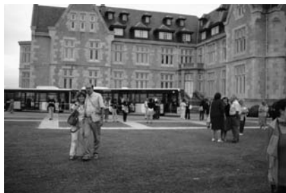
Visita al Palacio de la Magdalena