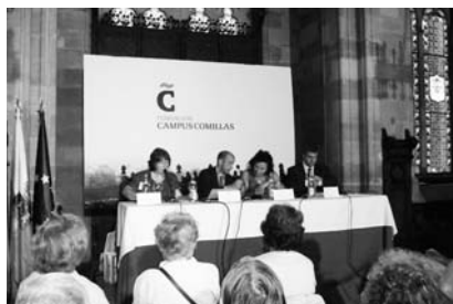
Sesión académica en Comillas.