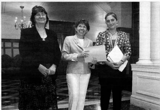
La vicerectora junto con las dos ponentes.

Enfaticó el carácter “internacional” de la Asociación Europea de Profesores de Español y, a modo de ejemplo, apuntó que los 150 participantes llegarán a Cantabria procedentes de una veintena de países.