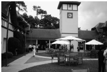
Las Caballerizas de La Magdalena

Al final de agosto quedó sacudido el mundo cultural de Madrid por la repentina dimisión de la directora de la Biblioteca Nacional, la escritora Rosa Regás. Dice que lo hizo por la falta de confianza que tiene en ella el actual ministro de Cultura, César Antonio Molina, anterior director del Instituto Cervantes. Se barajaba la hipótesis de que la dimisión se debía al robo recientemente descubierto de dos mapamundi de la Cosmografía en incunables de 1482, robo que está siendo investigado por la Guardia Civil, pero según Regás, no es ésta la razón de su dimisión. Sea cual fuera la razón, con la dimisión de esta escritora, nacida en 1933, la polémica está servida.