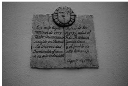
Placa conmemorativa de La Barraca en Las Caballerizas.