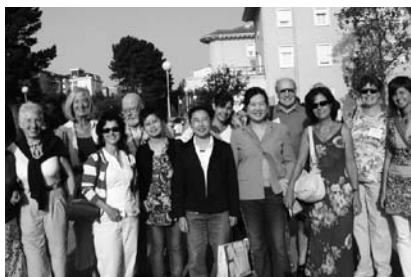
Preparados para una excursión.